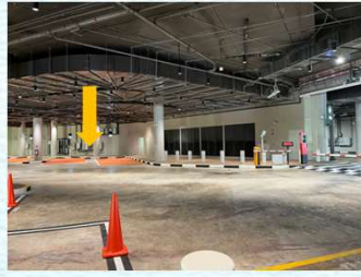
イースト/地下駐車場19-20番付近