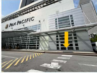
ラッフルズブルバード道路側入口